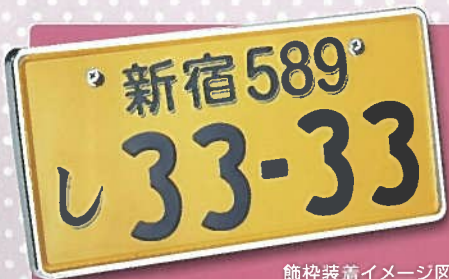
飾枠装着イメージ図