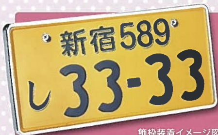
飾枠装着イメージ図